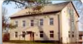
Skrundas Mūzikas skola