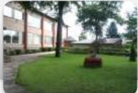
Skrundas pirmsskolas izglītības iestāde "Liepziediņš"